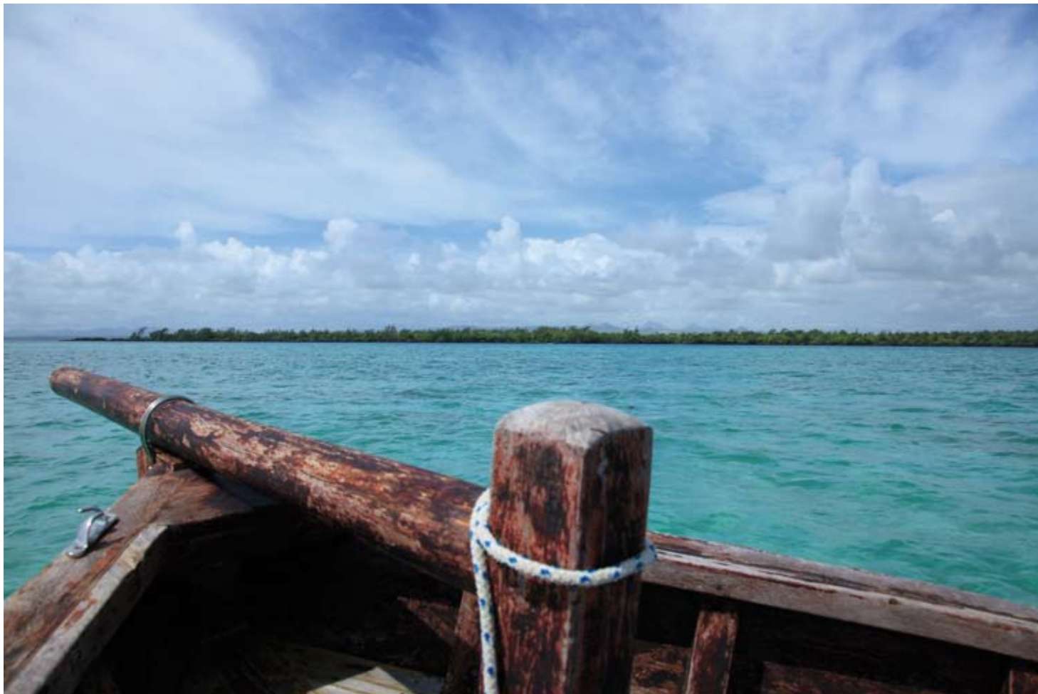
A LA FOIS SAUVAGE ET ACCESSIBLE, « LILDAM » EST L'UN DES 49 ÎLOTS SATELLITES DE L'ÎLE MAURICE, DONT SEPT SONT PROTÉGÉS.

L'île d'Ambre — « Lildam » pour les intimes — c'est bien sûr le bleu mauricien inimitable, et la langue de corail immaculée qui assure la quiétude des flots. Mais ce petit caillou de 147 hectares — la plus grande île à l'intérieur du lagon néanmoins — est riche d'autres trésors plus discrets, et étonnamment préservés. Nettement moins fréquentés que le petit îlot Bernache voisin, haut lieu de pique-nique local, apprécié pour ses plages sableuses.