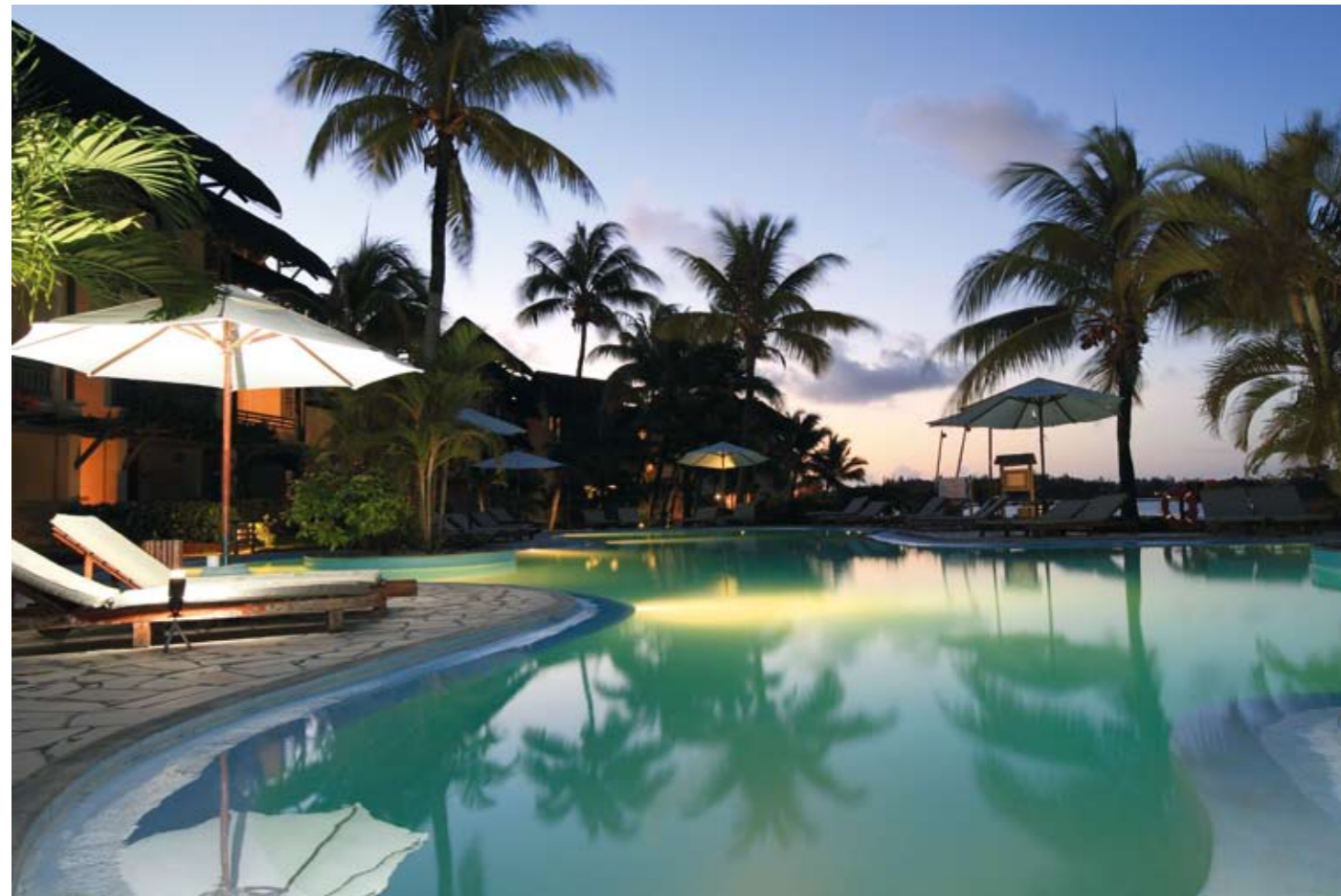
L'HÔTEL « PAUL ET VIRGINIE » RAPPELLE LA LÉGENDE DES AMANTS SÉPARÉS À JAMAIS PAR LE NAUFRAGE DU SAINT-GÉLAN, EN 1744, AU LARGE DE L'ÎLE D'AMBRE.